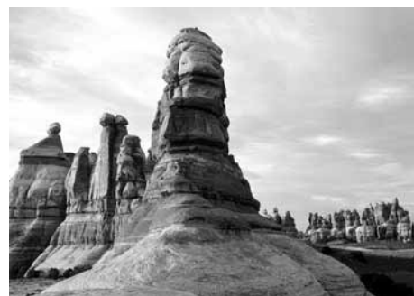
Chesler Park, The Needles

Dall'U.S. 191 prendere Utah 211 ovest verso i Needles. La strada lastricata continua nel parco. I servizi includono un centro visitatore, strade per 4x4, sentieri autoguidati e primitivi, campeggio attrezzati, aree da campeggio primitive (richiesto permesso per campeggio in aree remote), punti di veduta, programmi e discorsi del ranger (stagionali) e tour turistici organizzati dalle città limitrofe. L'acqua è disponibile tutto l'anno. Ingresso e campeggio a pagamento. Aperto tutto l'anno.