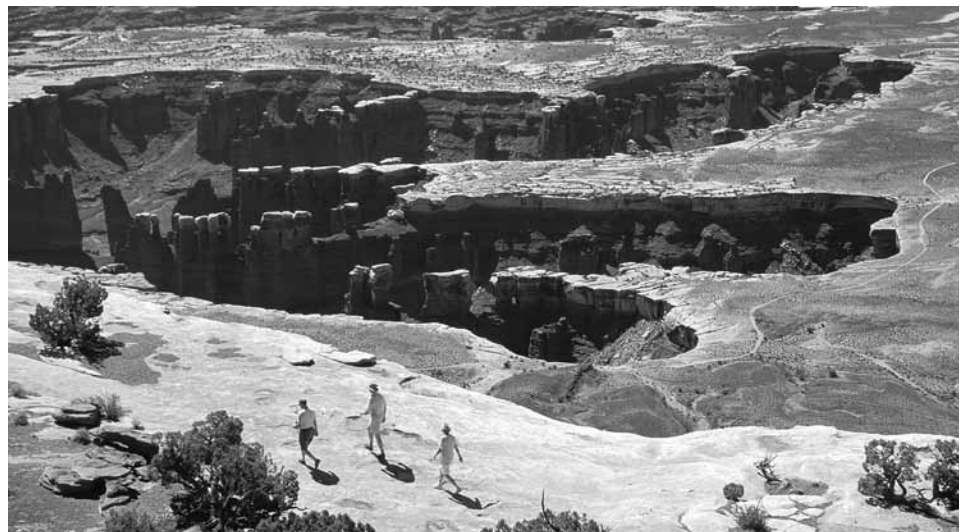
Grand View Point, Island in the Sky

Piattaforme rocciose che conducono al e al di sotto del White Rim sono l'habitat favorito per le pecore bighorn del deserto. Dall'Island mesa queste pecore appaiono come tante macchioline marroni; solo il più attento osservatore può riconoscerle. I sentieri intorno all'Island sono un buon posto per vedere la vita selvaggia, in particolar modo all'alba, all'imbrunire e nei mesi più freschi. I sentieri conducono